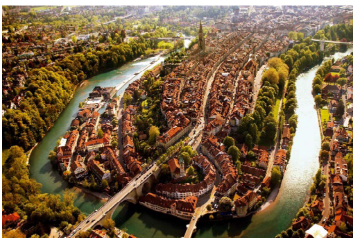
un'immagine di Berna

La Svizzera è ricca di fiumi (come il Reno) e di laghi (Lago di Ginevra, puoi chiamarlo anche Lago di Lemano, Lago di Neuchatel, Lago di Costanza).