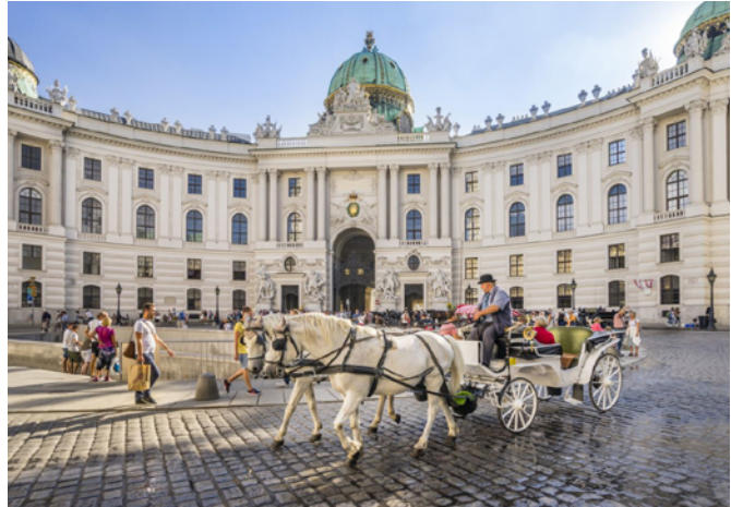
Un'immagine di Vienna

L'Austria è molto ricca di laghi e fiumi. In Austria scorre il Danubio che è il secondo fiume europeo per lunghezza (in Austria scorre per 350 km).